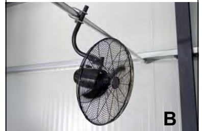
Baureihe 03.284 / 03.285