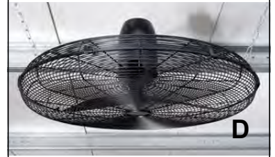
Baureihe 03.291 bis 03.312