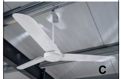
Baureihe 03.210 bis 03.225